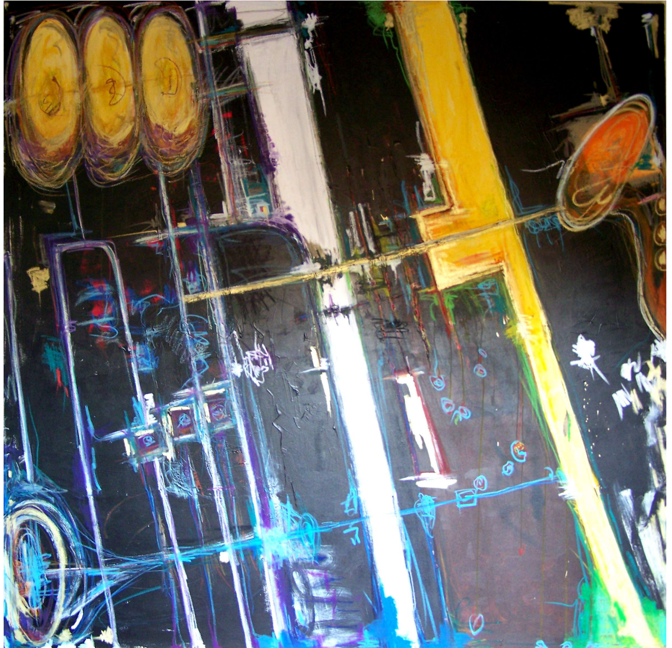
"Unión" Acrílico, crayones y lápices de óleo sobre lienzo 200 x 200 cm

Esta obra representa a los instrumentos de una forma parcial donde el negro se combina con los colores más estridentes. Es un todo diferente, pero ensamblado que simbolizan una banda de Jazz que desde la individualidad da forma a toda una comunidad. Cada parte tiene un significado particular pero, como el músico dentro de una banda, es en el conjunto donde adquiere su sentido más pleno y armónico. Y es que un solitario piano está callado, permanece en silencio. Como piezas que dan forma a un rompecabezas, los instrumentos se transforman en su individualidad para acompañar a las personas y crear ese milagro que es la música.