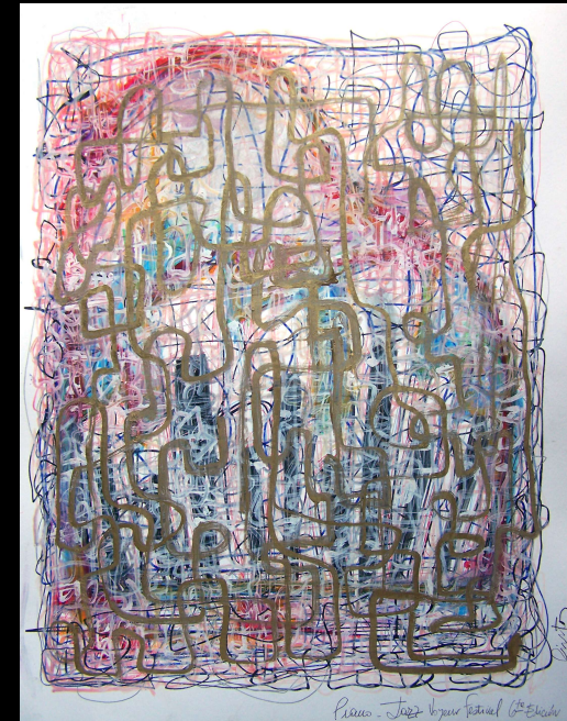
“La naturaleza de las cosas” Técnica mixta sobre papel 50 x 40 cm