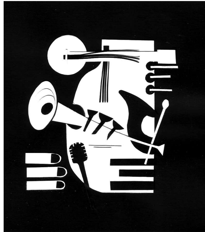
"Instrumentos" Collage de papel 10 x 10 cm

Esta fue la primera obra de la serie "El color del Jazz" que realizó Pepe Pintos y que ahonda en un concepto clásico de este género musical. En un primer punto de partida, Pepe Pintos proyecta un collage de instrumentos en blanco y negro; una visión preestablecida de este arte que el artista irá cambiando y llenando de color a medida que avanza la muestra pictórica-gastronómica. Tras un contacto más intenso con este arte, Pintos comprender que el jazz no es algo nocturno, de gente bohemia y oscura. Es así como llega el color a su obra y la visión lúdica y divertida de todo un universo en el que se comparte la música y las vivencias a través de un elegante sonido.