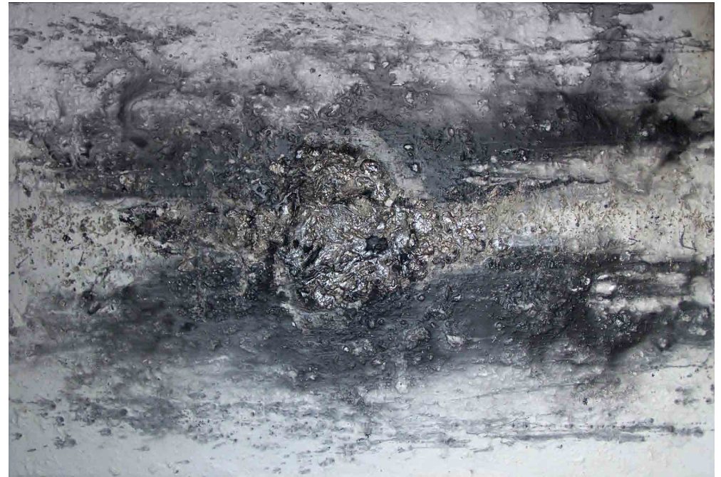
"Soledad" Técnica mixta sobre lienzo 100 x 150 cm