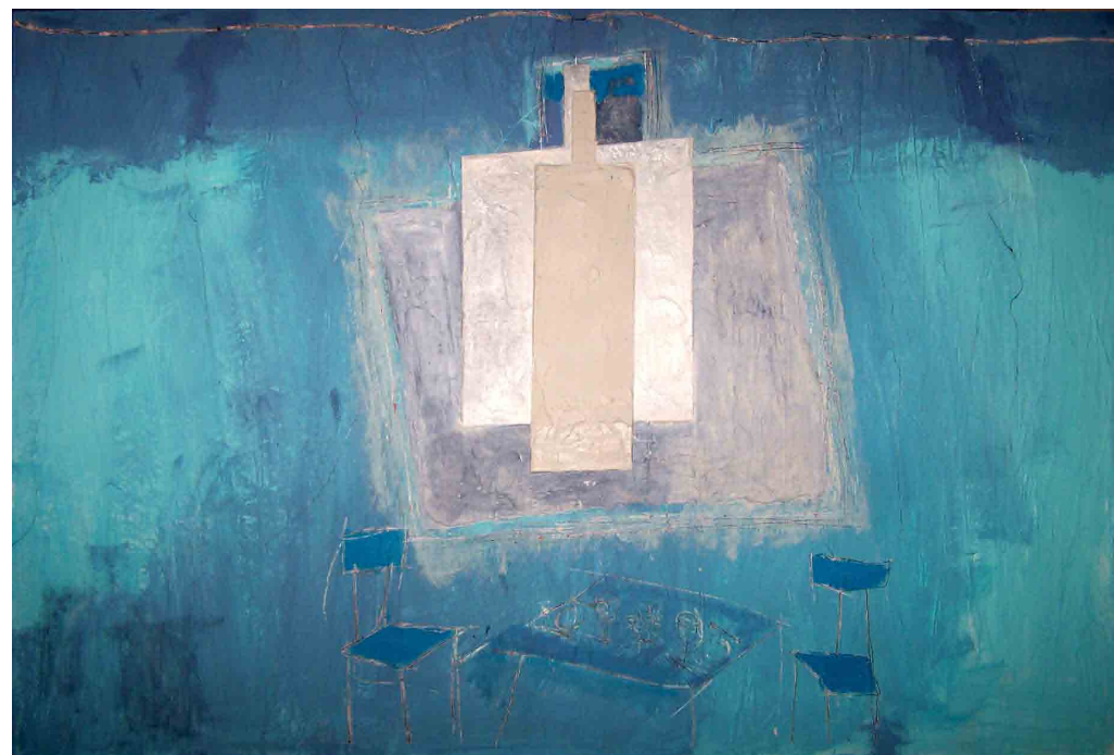
“Botella colgada del cielo y mesa montada para dos”