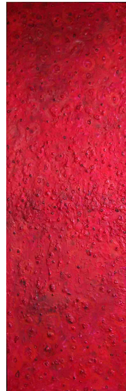
"Fermentación" Técnica mixta sobre lienzo 205 x 70 cm