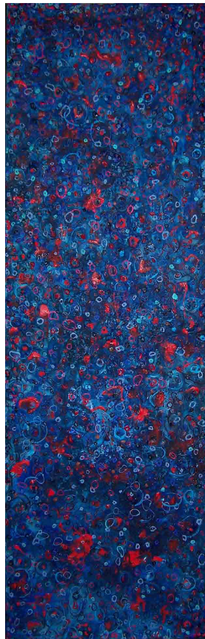
"Borras" Técnica mixta sobre lienzo 205 x 70 cm