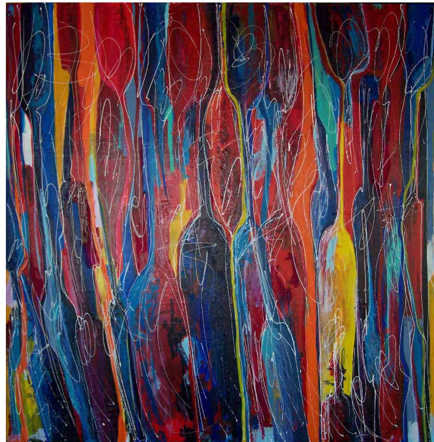
"Juntos" Acrílico sobre lienzo 120 x 120 cm